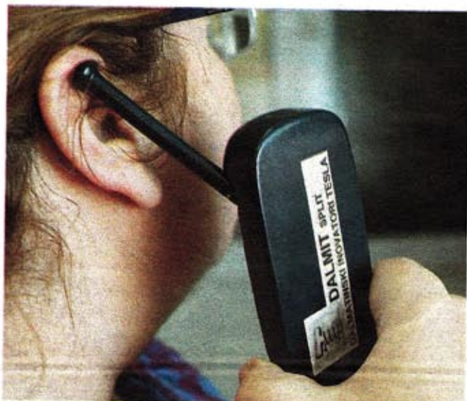
Originalni izum splitskih inovatora Nenada Popovića i Ivice Pivačića (desno)

Ovaj je patent jedan od brojnih koji su izišli iz splitskog "Dalmita", koji okuplja dalmatinske inovatore, a Pivačić, inače, predsjednik Zajednice tehničke kulture Splitsko-dalmatinske županije, nedavno je dobio i prestižnu državnu nagradu