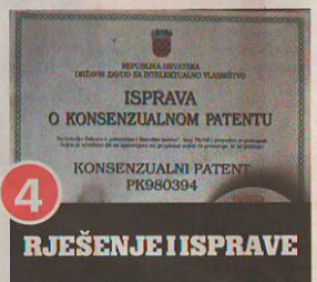
4 RJEŠENJE I ISPRAVE

Nakon prijave ideje nastupa vrijeme tajne koja traje godinu i pol dana. Službeno se postojanje prijave patenta obznani objavom u glasilniku Državnog zavoda u sažetom obliku, no sve ostalo ostaje obavljeno tišinom, između ostalog i kako bi se ideja zaštitila od nenamjernika. Prijavitelj se mora izjasniti što zapravo želi - patent ili patent s potpunim ispitivanjem.