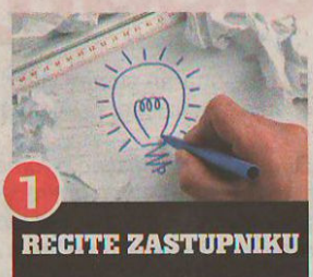
1 RECITE ZASTUPNIKU

Ideju je za početak potrebno podijeliti, kroz natuknice, skice ili već u razrađenom obliku, stručnjacima ovlaštenog patentnog zastupnika. Stručnjaci pritom daju mišljenje o ideji te se sugerira provjera, pretraživanje kako bi se vidjelo je li već negdje u svijetu nešto tako prijavljeno. Stručnjaci nakon uvida u svjetske patente baze sugeriraju daljnje korake.