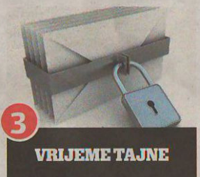
3 VRIJEME TAJNE

U slučaju daljnjeg postupka ovlaštenu patentni zastupnik izrađuje javnu dokumentaciju i počinje postupak prijavljivanja, a prva je postaja Državni zavod za intelektualno vlasništvo RH. S podnošenjem prijave prijavitelj od tog dana ima pravo prvenstva na svoju ideju. Od tog trenutka počinje postupak patentiranja koji može potrajati i do pet, šest ili više godina.